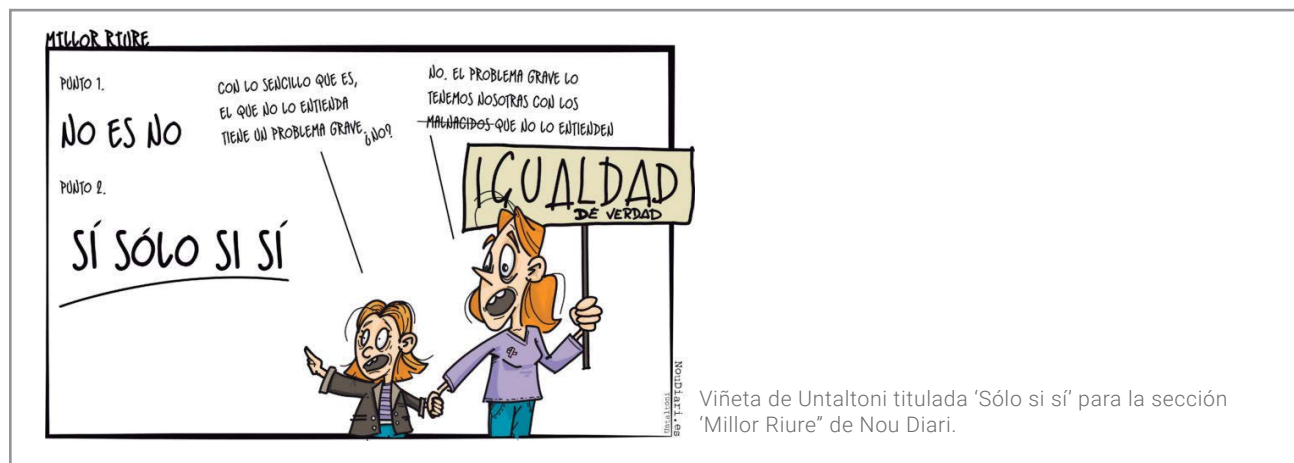
Viñeta de Untaltoni titulada ‘Sólo si sí’ para la sección ‘Millor Riure’ de Nou Diari.